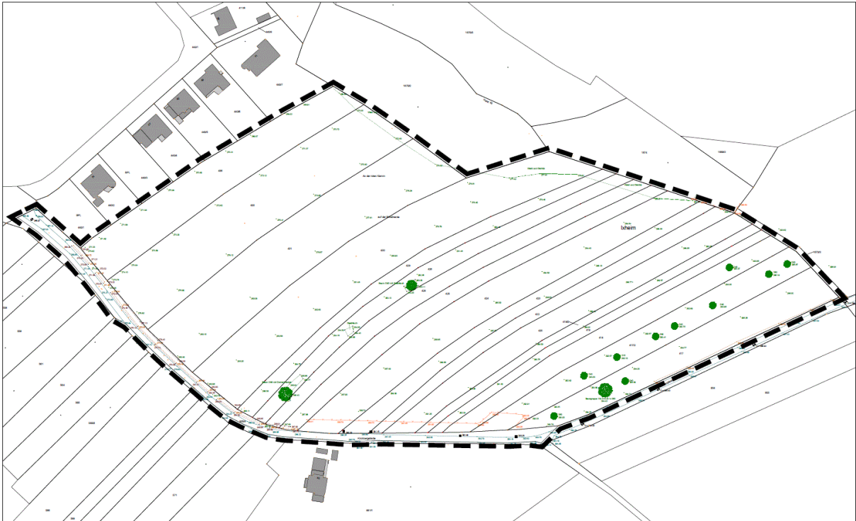
Lageplan mit Geltungsbereich, genordet, ohne Maßstab