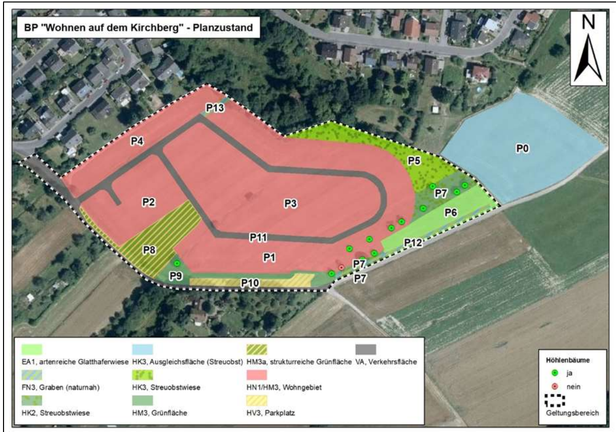
Lage der externen Ausgleichsfläche (P0) in Abgrenzung zu den Erfassungseinheiten im Plangebiet, genordet, ohne Maßstab

Weiterhin wird hiermit öffentlich bekanntgemacht, dass der naturschutzfachliche Ausgleich in engem naturräumlichem Zusammenhang angrenzend an den Geltungsbereich auf dem Flurstück 1673/7 Gemarkung Ixheim, stattfindet. Die Lage der externen Ausgleichsflächen ist der folgenden Abbildung sowie dem Umweltbericht zu entnehmen.