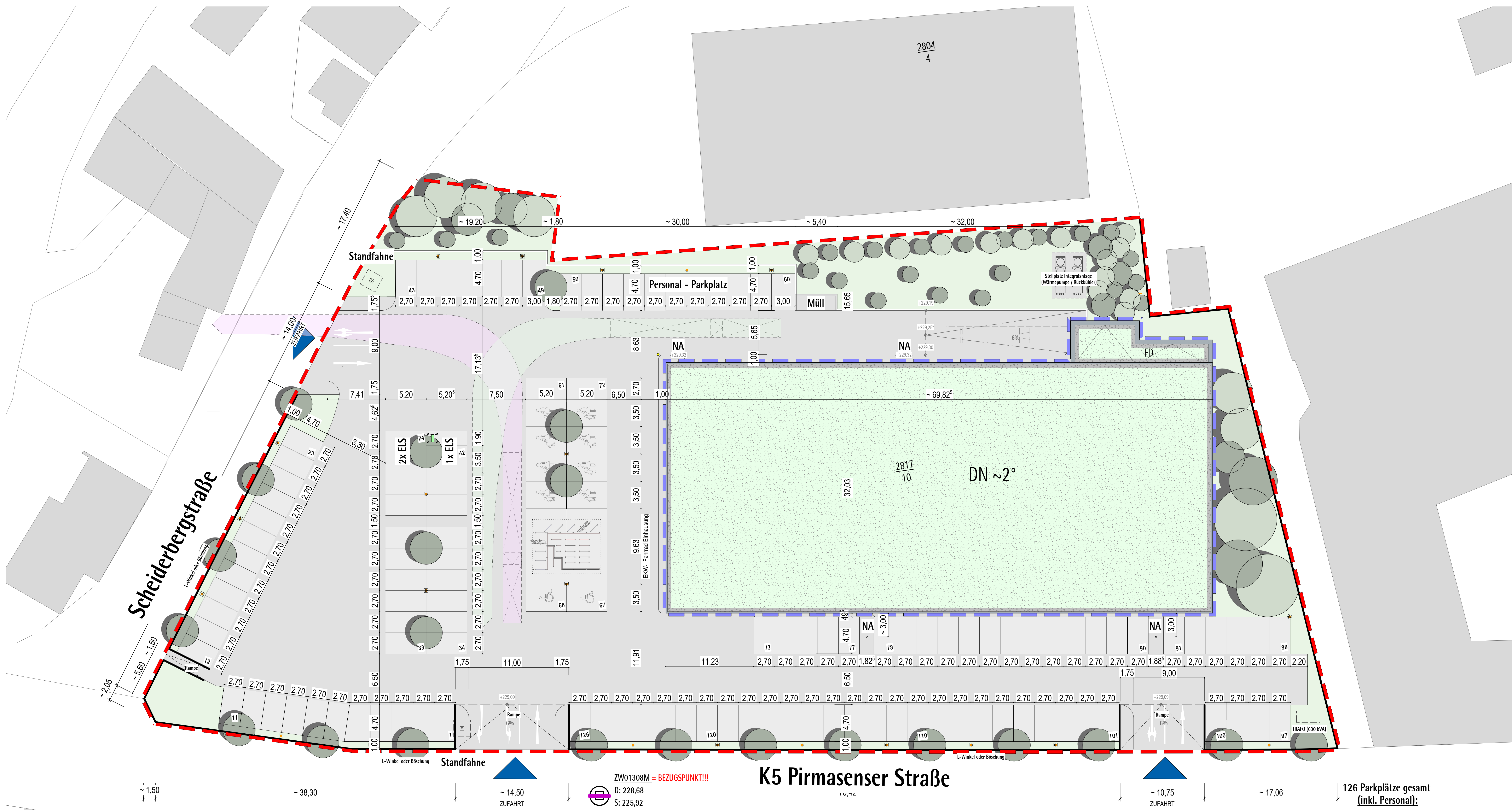
LAGEPLAN AUSSENANLAGE | M 1:200