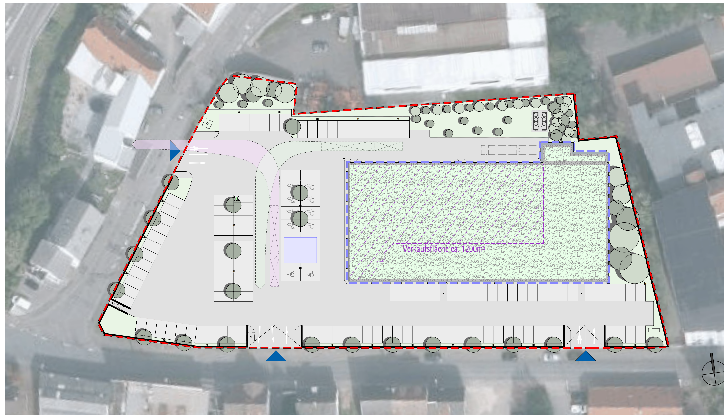
LAGEPLAN LUFTBILD | M 1:500