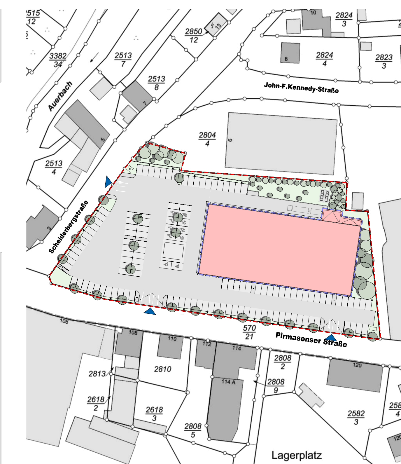
LAGEPLAN | M 1:1000