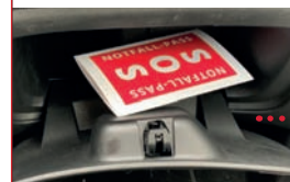
...in der Handtasche ...im Handschuhfach

SOS-Rettungs-Pässe erhalten Sie in der Rats-Apotheke, Zweibrücken, Poststr. 5