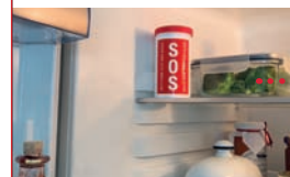
Aufbewahrung im Kühlschrank...

In der SOS-Rettungs-Dose und in dem SOS-Notfall-Pass befindet sich ein Datenblatt. Dieses enthält für Rettungsdienste oder den Notarzt wichtige Informationen zu der Person, die medizinisch versorgt werden muss.