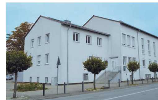
Das Seniorenbüro Zweibrücken im Informations- und Beratungszentrum, Poststr. 40

Poststr. 40, Zimmer 010 66482 Zweibrücken Tel. 06332-871-531 / -530 www.zweibruecken.de michael.seebald@zweibruecken.de