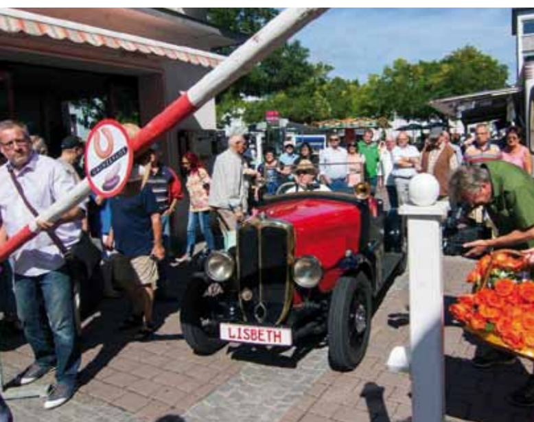
Journée des Sarrois au centre-ville