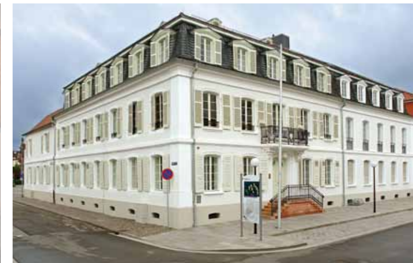
Musée de la ville dans la Petrihaus

L'histoire passionnante et mouvementée de l'ancienne résidence ducale a été explorée et transmise par de nombreux historiens et citoyens. Aujourd'hui, l'histoire de Zweibrücken est divulguée par des guides touristiques engagés.