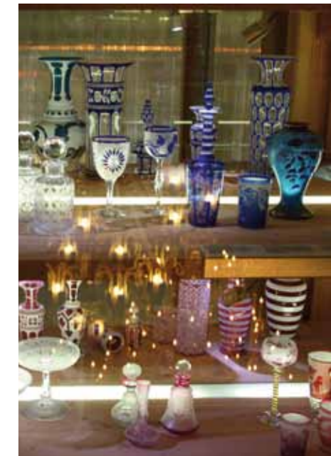
Musée du Cristal à Saint-Louis-lès-Bitche