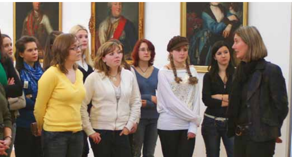
Au musée de la ville