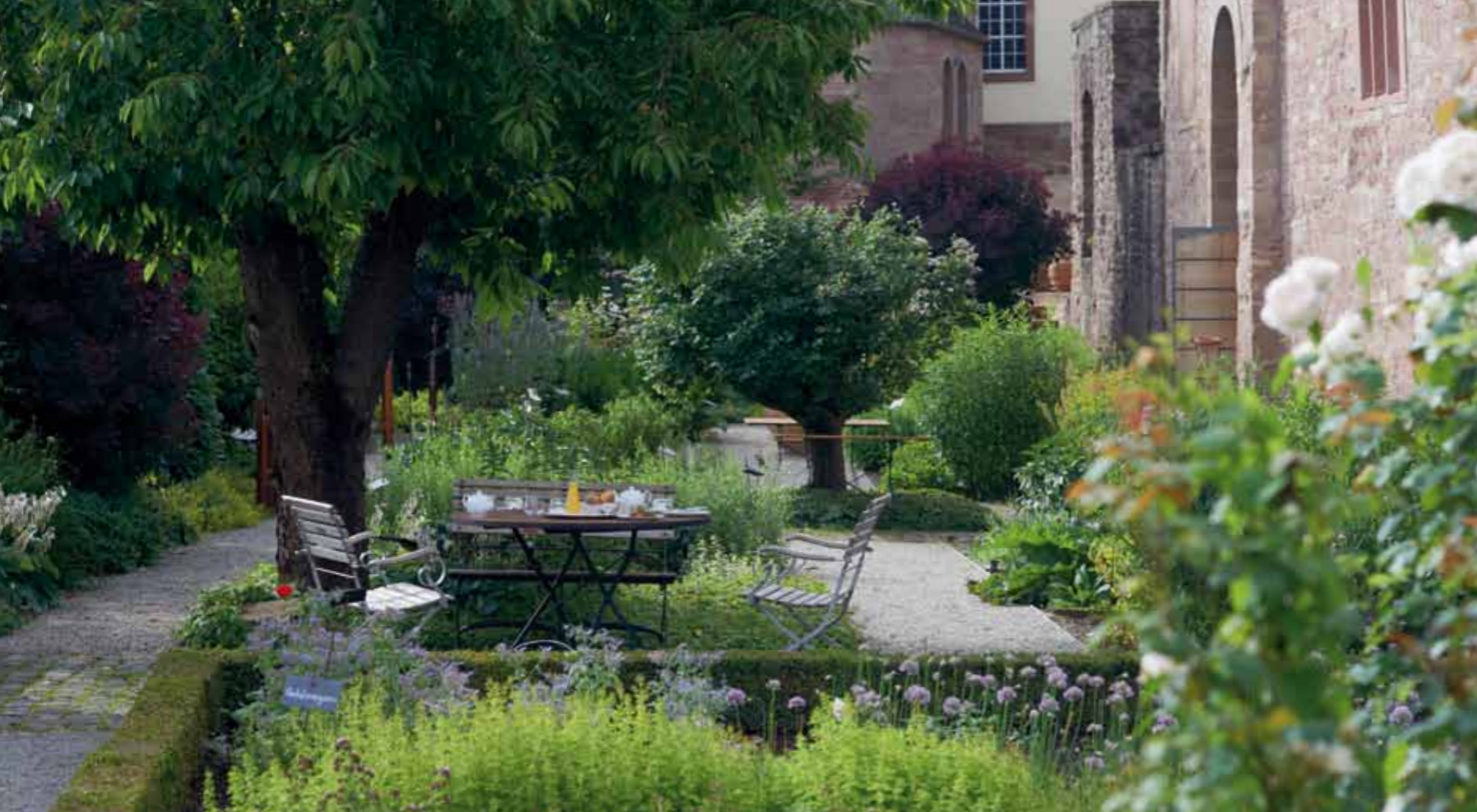
Jardin de plantes aromatiques du monastère de Hornbach