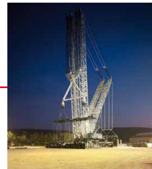
Tadano Demag Germany GmbH