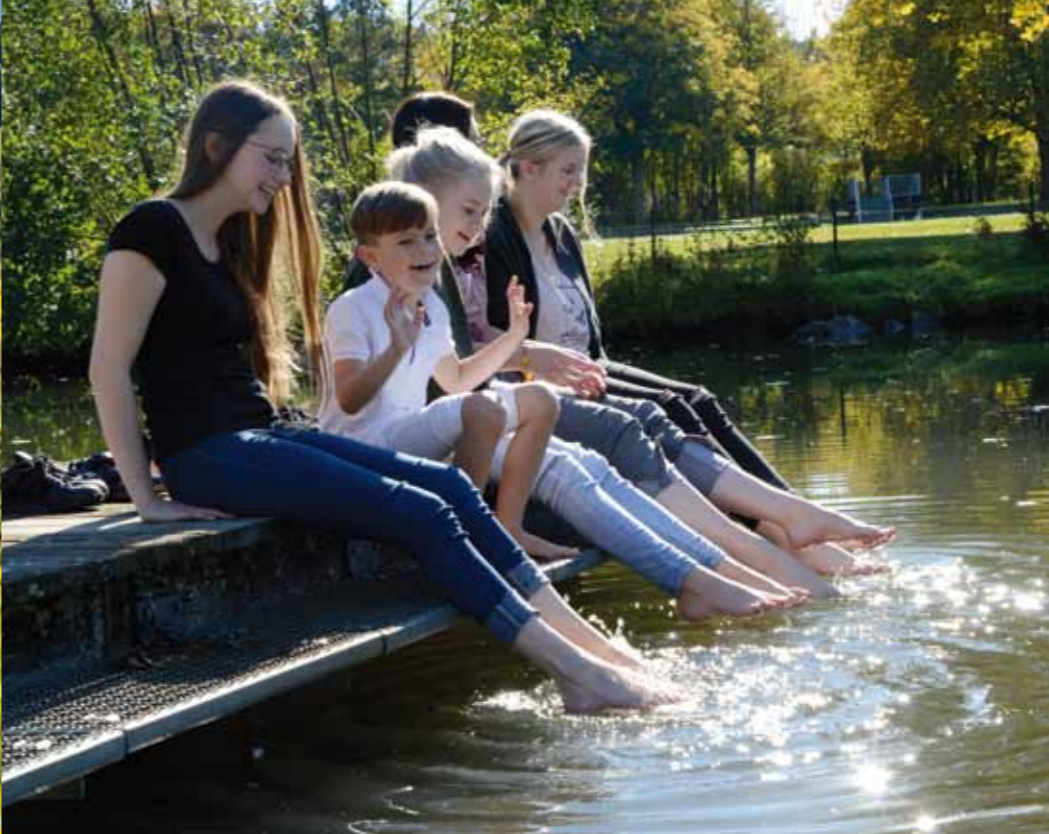
Une ville au bord de l'eau Guldenschlucht, la « Gorge aux Florins »