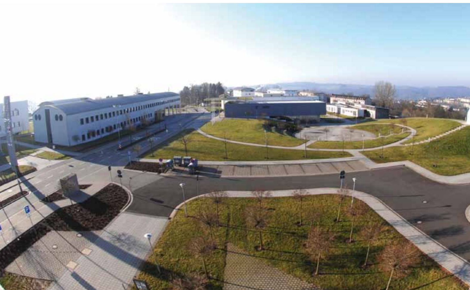
Campus universitaire de Zweibrücken

Le site universitaire de Zweibrücken se distingue par ses innovations dans les domaines de la technologie d'information, de communication et des micro-systèmes ainsi que dans les secteurs de croissance que sont la biotechnologie et la technique médicale. www.hs-kl.de