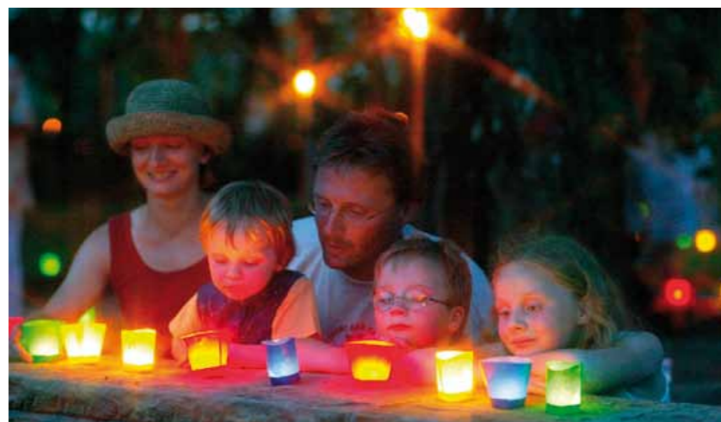
Fête des 1 000 lumières

Oasis verte de 45 000 m 2 située à deux pas du centre-ville, la Roseraie ( Rosengarten ) est depuis plus d'un siècle un pôle d'attraction pour les visiteurs du monde entier. Plus de 1 500 espèces et variétés de roses agrémentent un espace élégant et soigné de bosquets, de fleurs et d'étangs. La Roseraie héberge une grande tribune de manifestations, des jardins à thèmes, un petit musée de la rose et le café « Dornröschen ». En plus de la Roseraie sauvage ( Wildrosengarten ), du jardin Rücker et du monument horticole baroque, la Roseraie constitue l'une des étapes du voyage horticole de Zweibrücken.