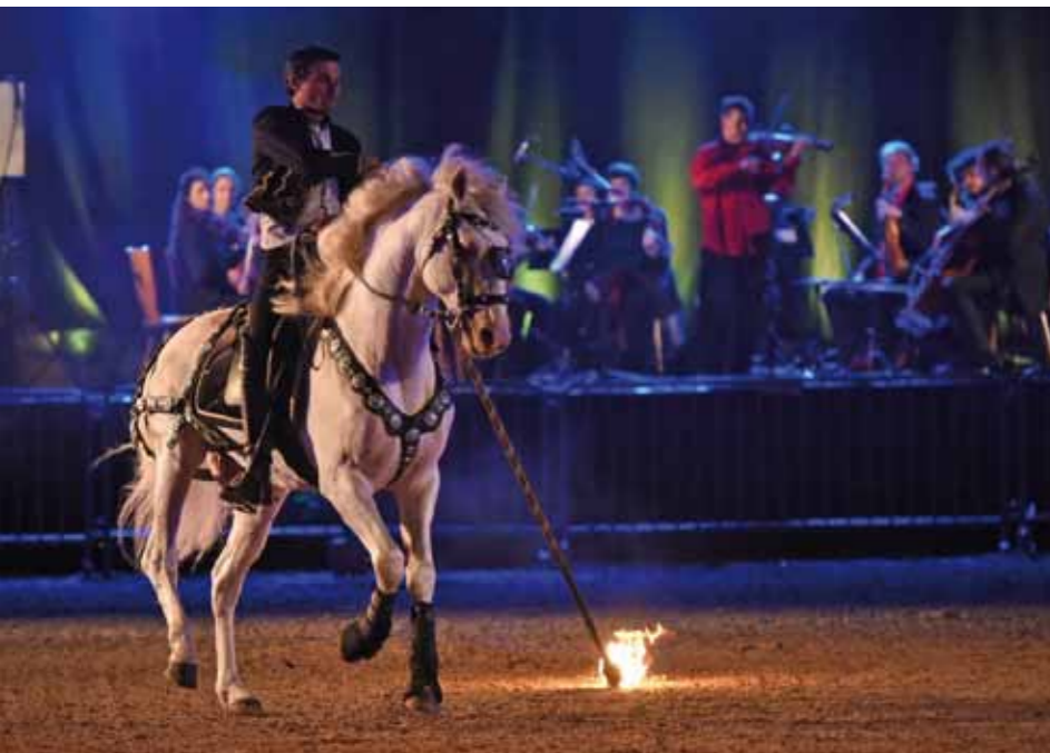
Spectacle classique & équestre au haras