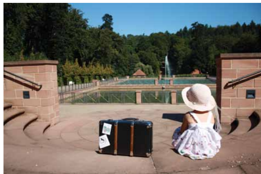
Monument horticole baroque Tschifflick