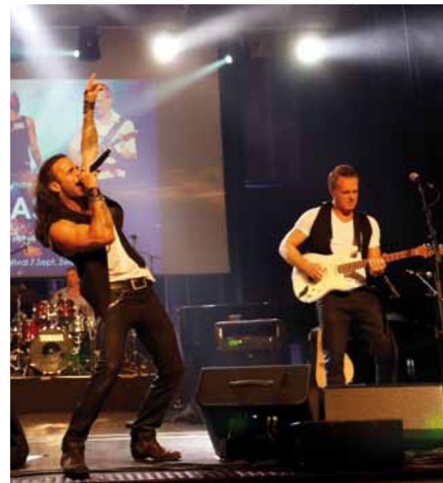
Concerts à la Festhalle