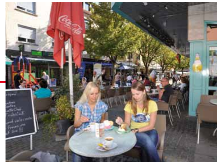
Glacier au centre-ville