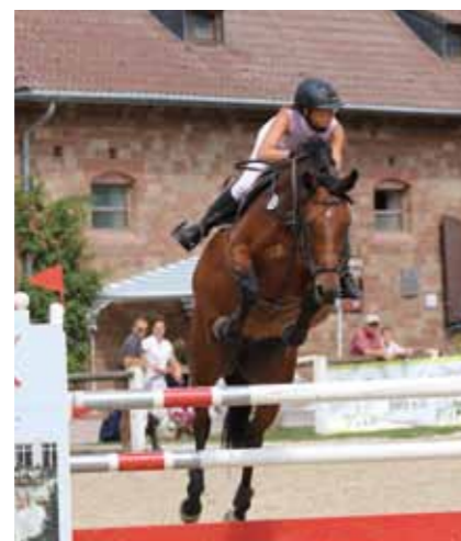
Saut d'obstacles au haras