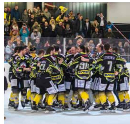
Ice Arena / EHC Hornets