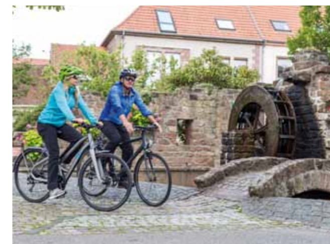
Sentier cyclable européen des moulins

En amont, le long de la rivière Schwarzbach, se trouve Thaleisweiler avec son nouveau sentier de découverte autour de l'eau ( Wasserschau Pfad ). Du côté français, les visiteurs admireront la Citadelle de Bitche et le Jardin pour la Paix, le musée du cristal de Saint-Louis-lès-Bitche ou encore le centre d'art verrier à Meisenthal.