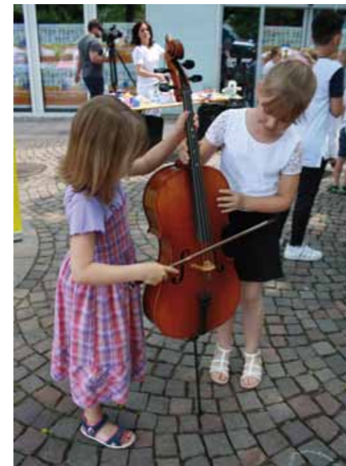
Journée musicale des enfants

« Les cerises de Tschifflick » : la femme de chambre du duc propose une visite guidée du monument horticoles baroque à la Faisanderie ( Fasanderie ). Elle dévoile les joies et les peines du bon vivant Stanislas Leszczyński et l'histoire fatidique de sa famille – joie de vivre, intrigues, nostalgie et espoir... de quoi en faire un film !