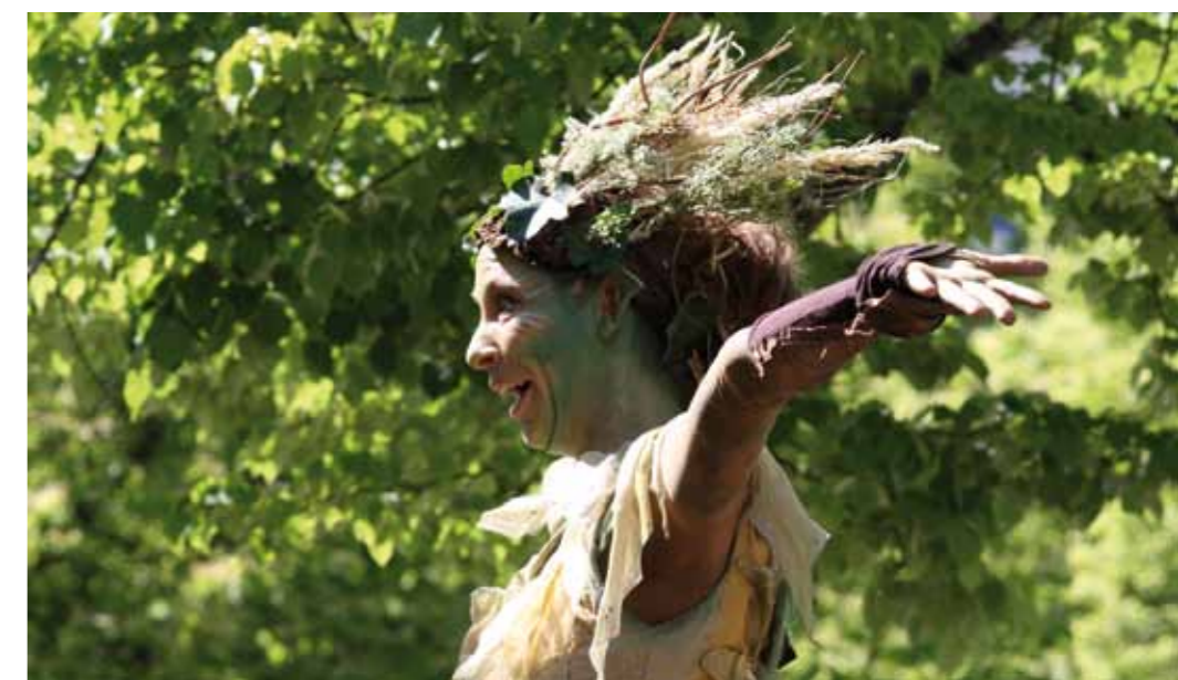
Théâtre de rue