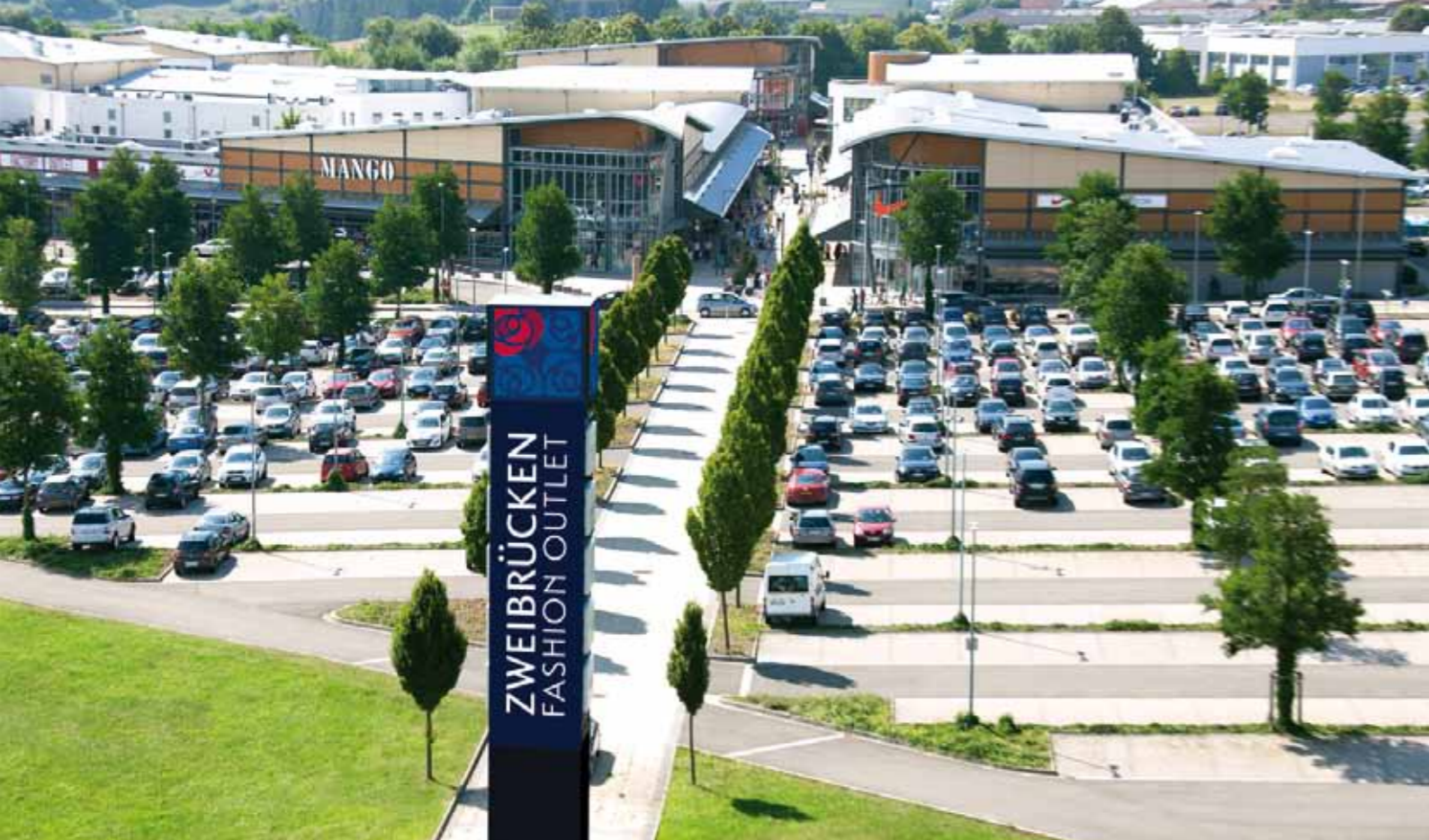
Zweibrücken Fashion Outlet