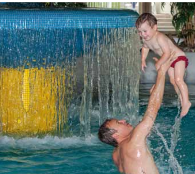
Piscine aqualudique « Badeparadies »