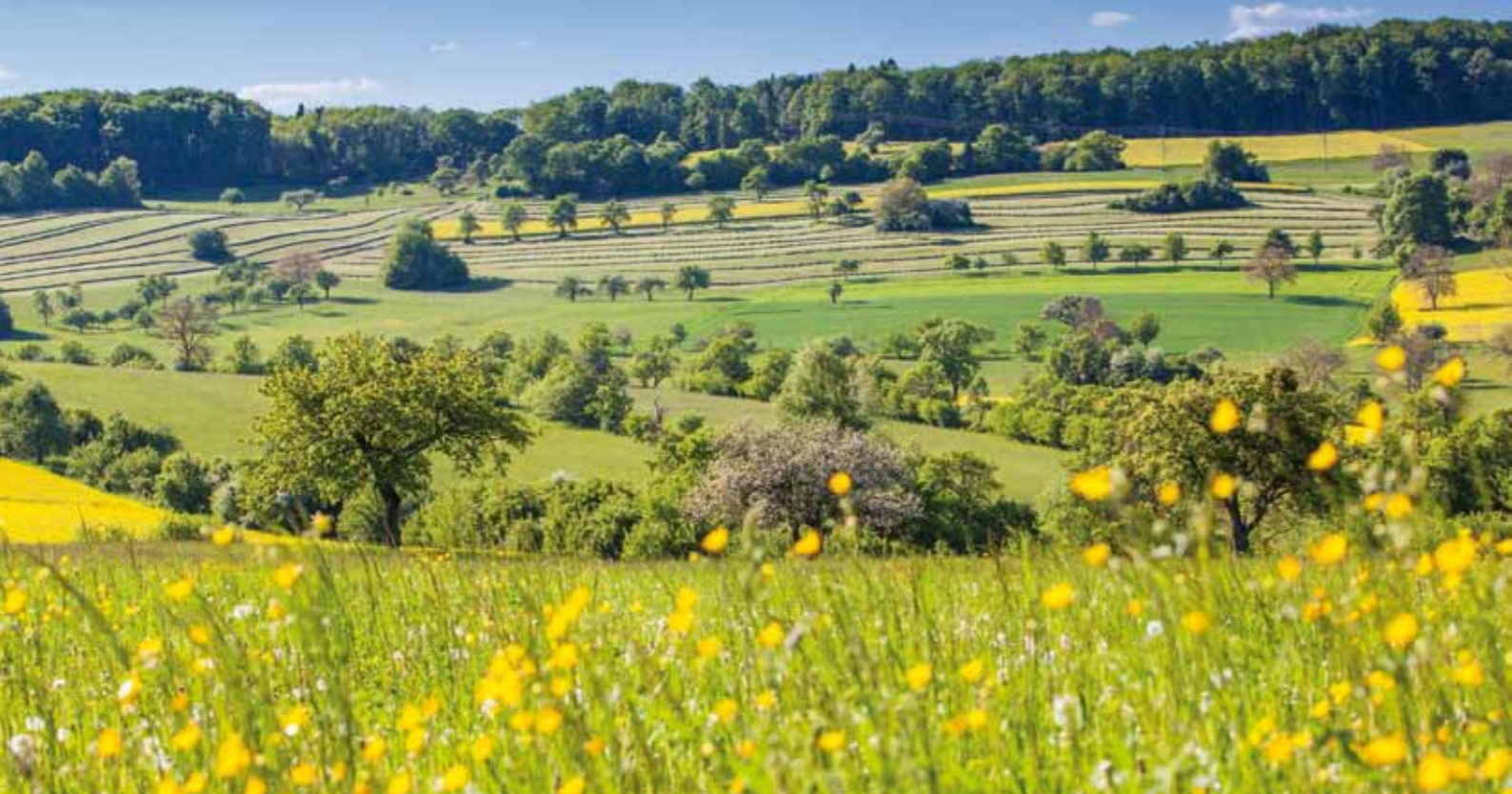
Réserve de biosphère Bliesgau