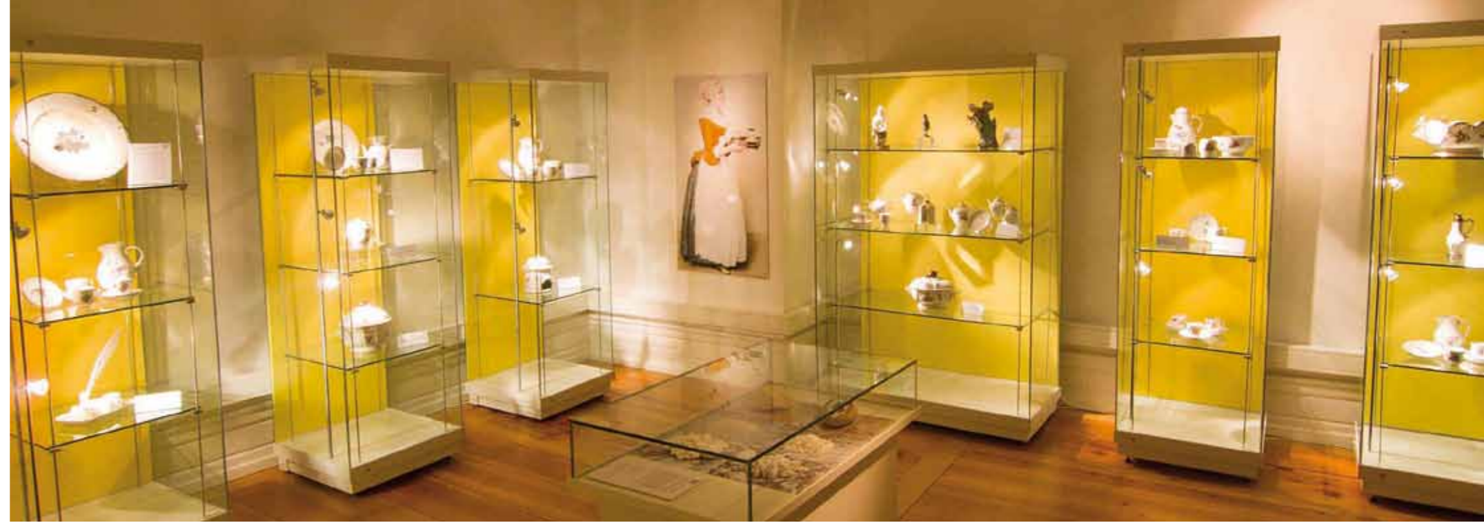
Porcelaine de Zweibrücken au musée de la ville

Pour élargir son horizon, rien de tel que les visites guidées de la ville avec sa tradition baroque et son Haras régional, du musée de la ville, des excursions dans les prés et forêts du parc naturel Pfälzerwald et des Vosges du Nord. Selon les goûts, les déplacements se feront à pied, en calèche, à cheval ou sur une barque. Une visite guidée de la Bibliotheca Bipontina, l'ancienne bibliothèque des ducs, est également possible.