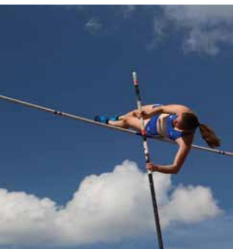
Saut à la perche au LAZ Zweibrücken

Grâce à ses nombreuses écoles, la ville bénéficie du plus grand nombre d'insignes sportifs de toute la Rhénanie-Palatinat.