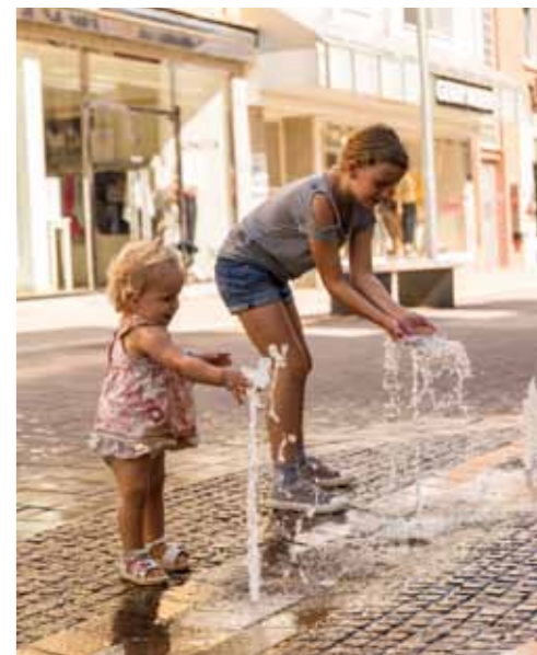
Jeux d'eau dans la zone piétonne