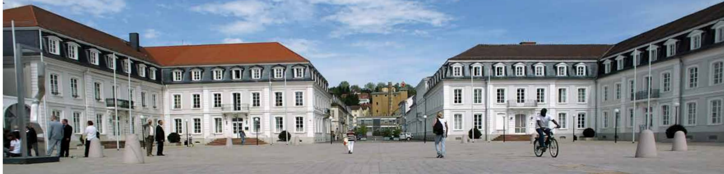
Place ducale ( Herzogplatz )

Selon une coutume fort répandue au XVIII e siècle, la construction de la Place ducale ( Herzogplatz ) fut financée par une loterie. Les fonctionnaires ducaux et les communes durent acheter un billet. Outre des prix en espèces, les gros lots furent les maisons bordant la célèbre place.