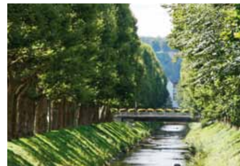
Arbres bordant la Schwarzbach