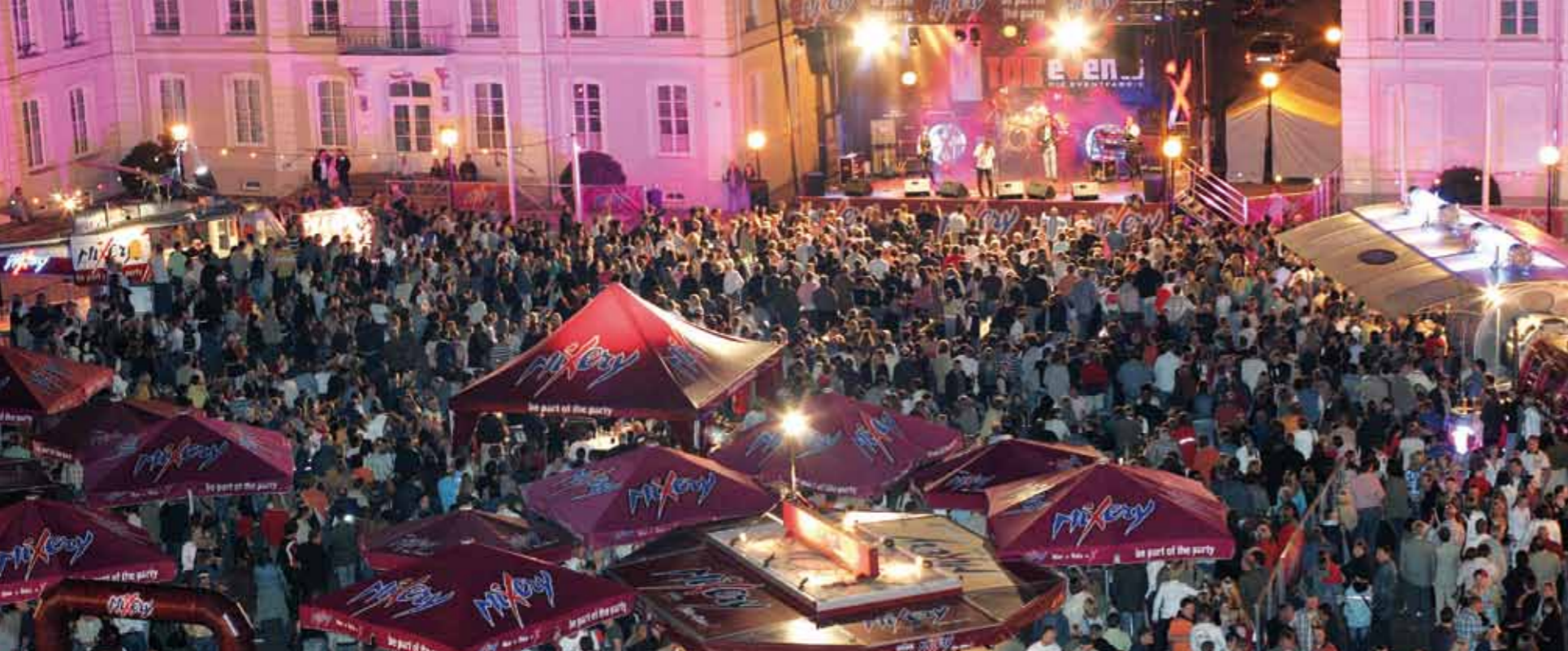
Fête de la Ville

Lorsque près de 80 artistes et groupes musicaux produisent 200 heures de musique sur neuf scènes et que tous les souhaits sont comblés par plus de 150 buvettes et stands, cela signifie la Fête de la Ville ( Stadtfest ) !