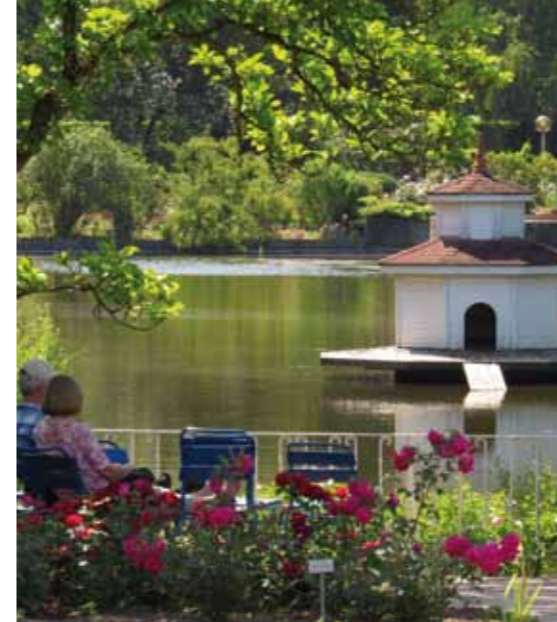
Étang de la roseraie