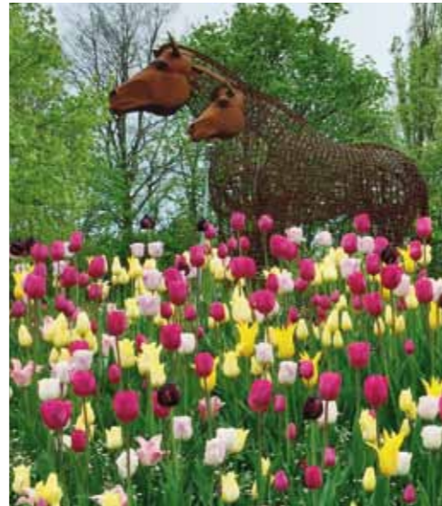
Une ville fleurie