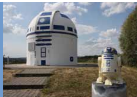
Observatoire de Zweibrücken

En 1994, dans le cadre de sa reconversion, un campus de l'université de Kaiserslautern a été aménagé dans les anciennes casernes de l'armée américaine. Aujourd'hui, des étudiants de plus de 50 pays passent leurs diplômes sur le site universitaire de Zweibrücken.