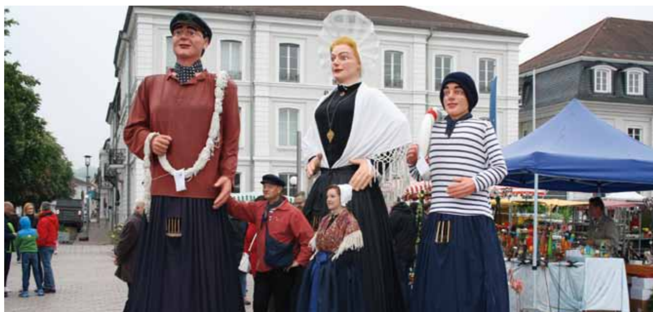
Artistes déambulateurs de Boulogne-sur-Mer