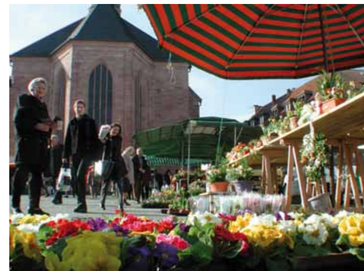
Marché hebdomadaire au Alexanderplatz