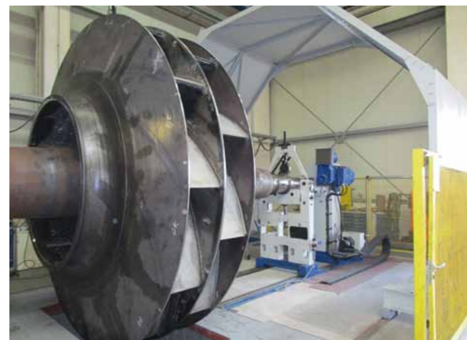
Roue radiale, TLT-Turbo