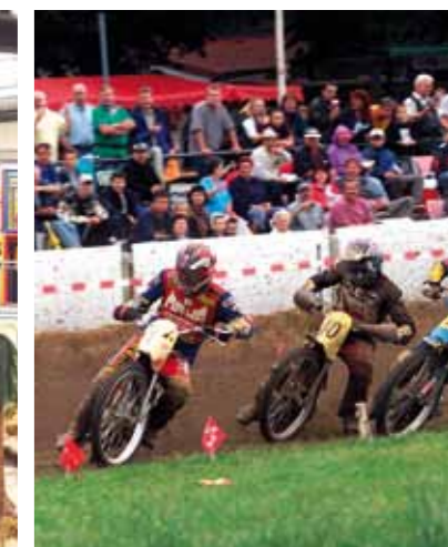
Course de motos