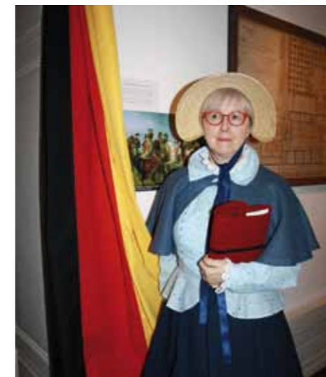
« Schau!Platz Freiheit »