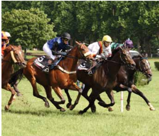
Course hippique à l'hippodrome