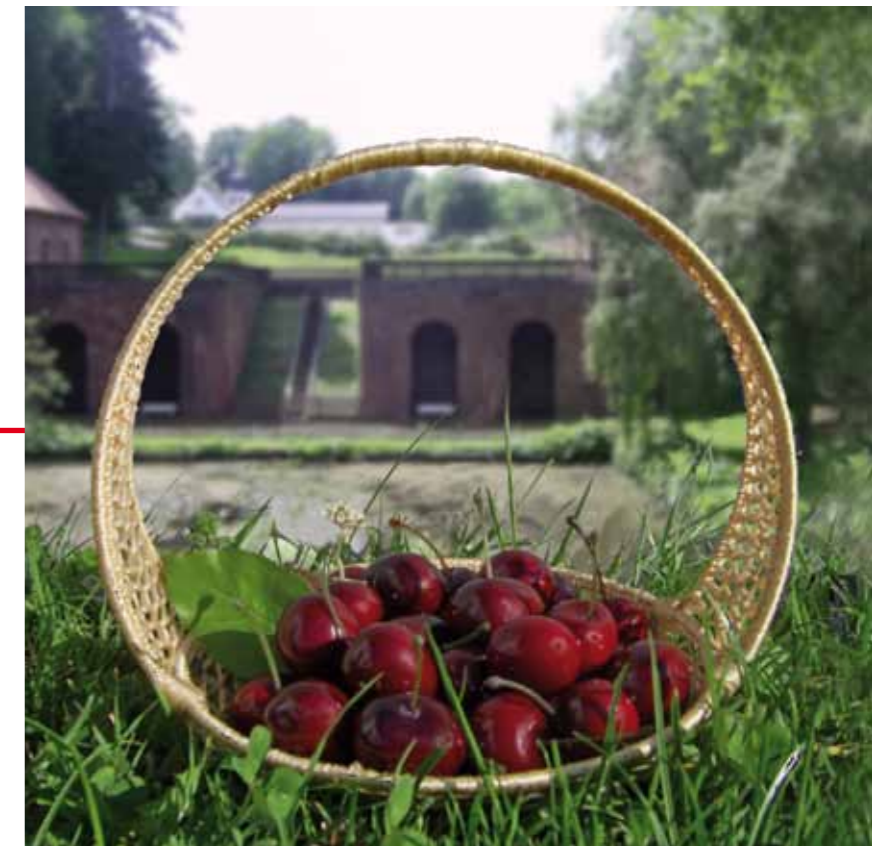
« Les cerises de Tschifflick »