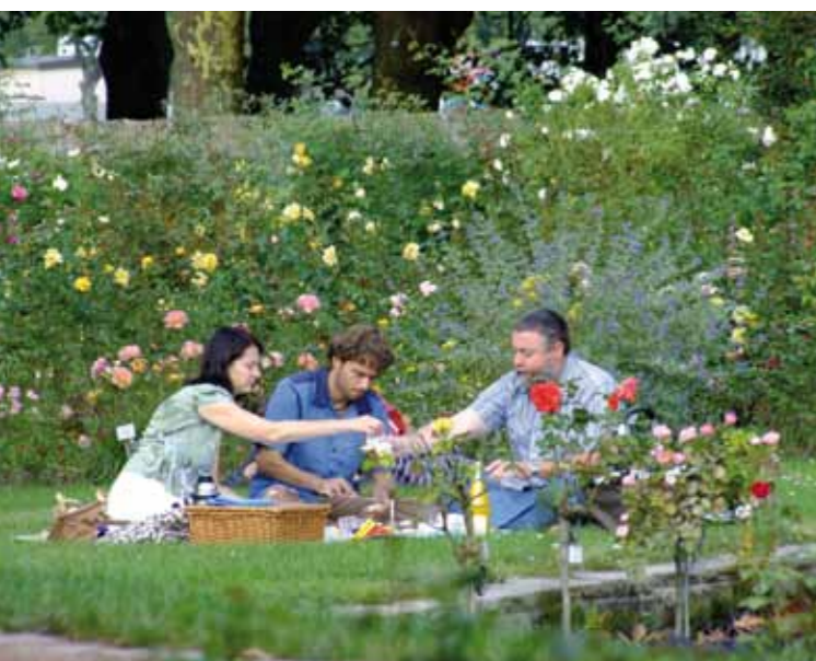
Pique-nique au parc

La Roseraie ( Rosengarten ) propose des activités variées – concerts, pique-niques, journées de la rose ( Rosentage ), marchés horticoles, séminaires et visites guidées. Dans le cadre de la « Fête des 1 000 lumières », le jardin entier respendit à la lueur des bougies.