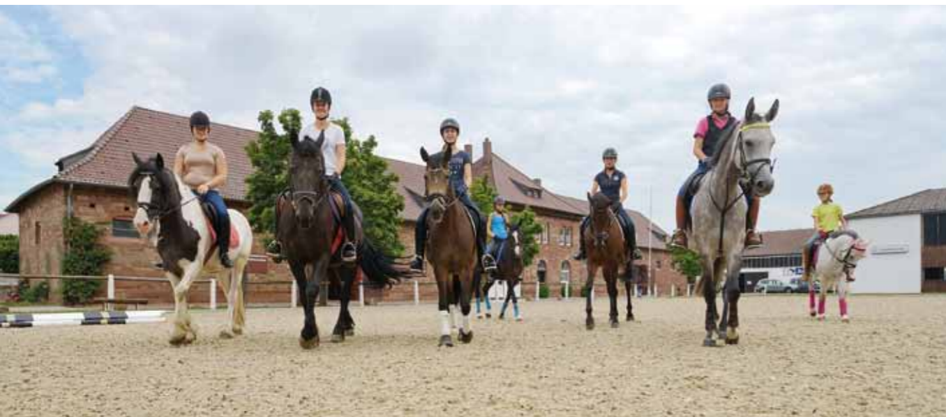
Cours d'équitation au Haras régional

Étalons dynamiques et poulains affectueux – ça bouge au Haras régional ( Landgestüt Zweibrücken ) : courses hippiques, tours en calèche, cours d'équitation et de voltige équestre, sans oublier le grand gala équestre.