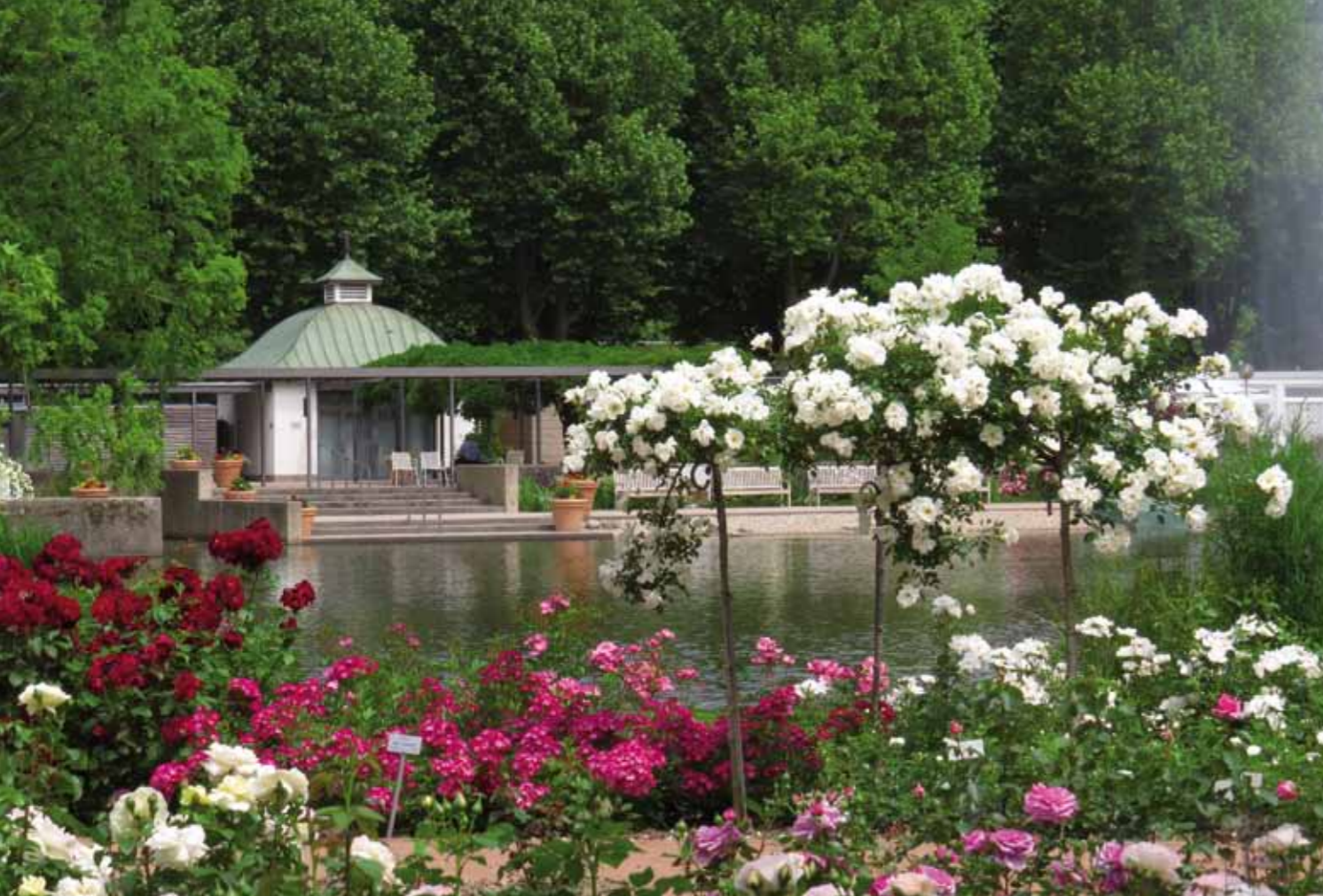
Des roses splendides