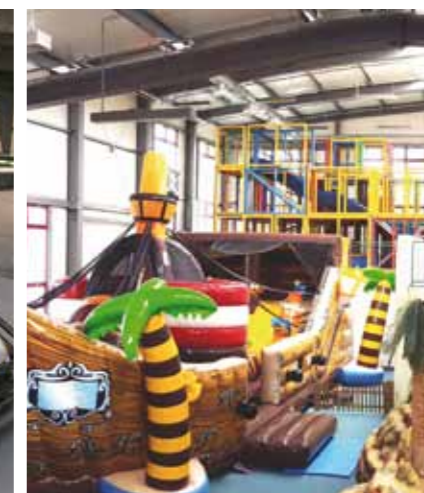
World of Fun