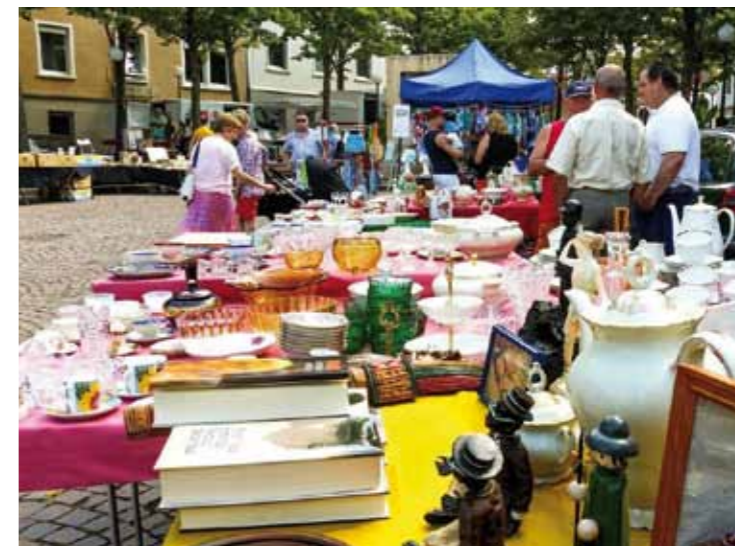
Marché aux puces au Schlossplatz

www.gemeinsamhandel-zw.de www.zweibrueckenfashionoutlet.com