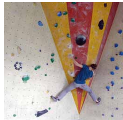
Salle d'escalade Camp4